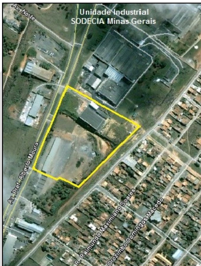
Imagem 1: Destaque da área de ampliação do empreendimento (unidade em operação acima). Adaptado de Google Earth, 2005.

Segue imagem ilustrativa de localização da área de ampliação da unidade industrial da SODECIA Minas Gerais Indústria de Componentes Automotivos LTDA., conforme coordenadas geográficas extraídas dos estudos ambientais: