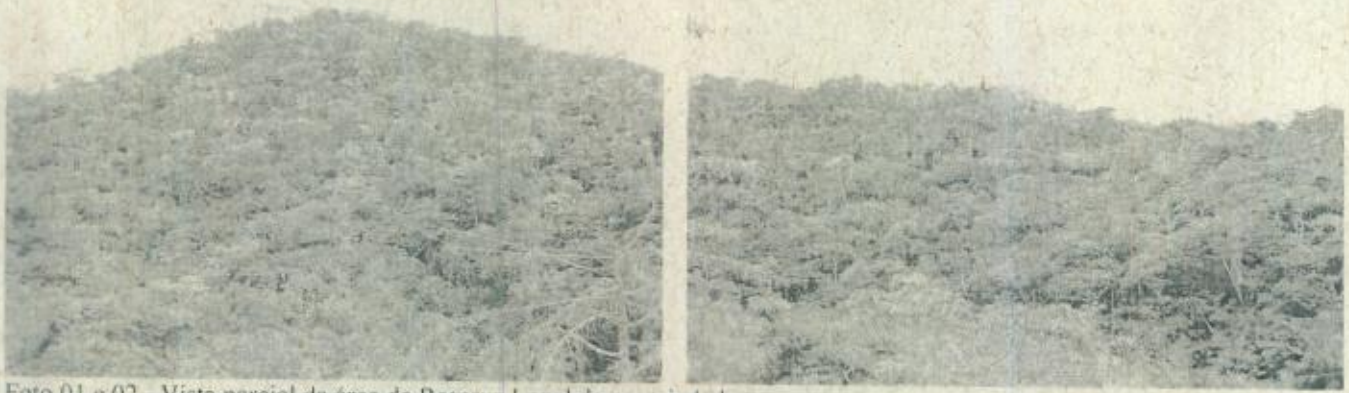
Foto 01 e 02 - Vista parcial da área de Reserva Legal da propriedade.