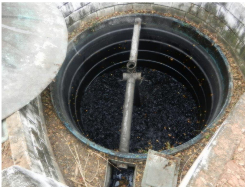
Foto: Lacramento, desativação da saída da ETE Sanitária e Recolhimento do Efluente por empresa licenciada – Brembo do Brasil Ltda