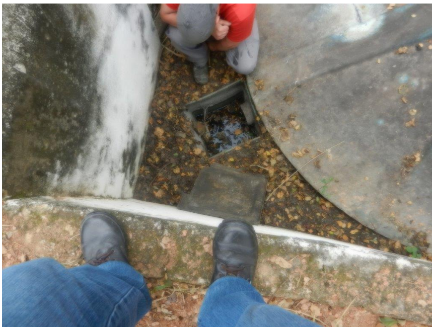
Foto: Lacramento, desativação da saída da ETE Sanitária e Recolhimento do Efluente por empresa licenciada – Brembo do Brasil Ltda