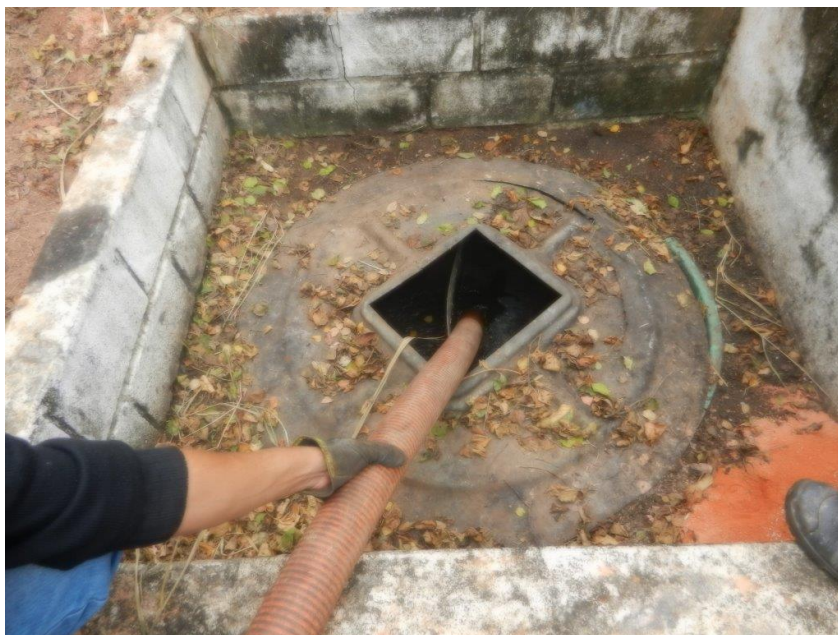
Foto: Lacramento, desativação da saída da ETE Sanitária e Recolhimento do Efluente por empresa licenciada – Brembo do Brasil Ltda