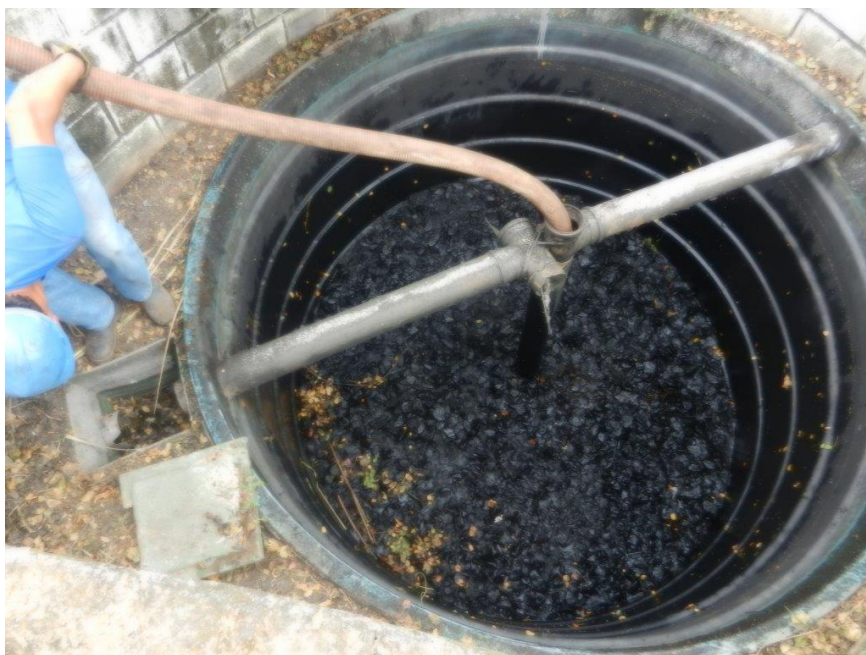
Foto: Lacramento, desativação da saída da ETE Sanitária e Recolhimento do Efluente por empresa licenciada – Brembo do Brasil Ltda