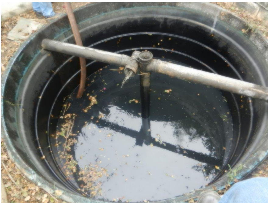
Foto: Lacramento, desativação da saída da ETE Sanitária e Recolhimento do Efluente por empresa licenciada – Brembo do Brasil Ltda