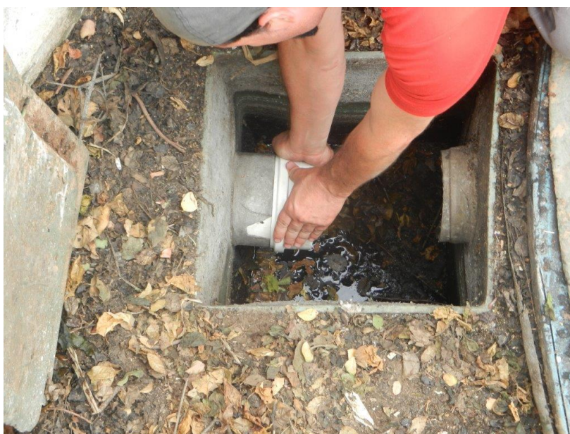
Foto: Lacramento, desativação da saída da ETE Sanitária e Recolhimento do Efluente por empresa licenciada – Brembo do Brasil Ltda