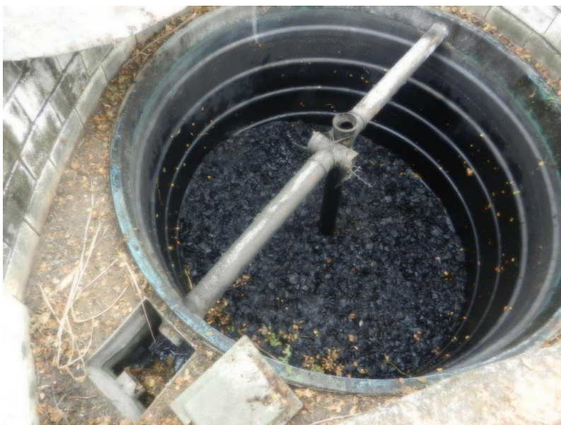
Foto: Lacramento, desativação da saída da ETE Sanitária e Recolhimento do Efluente por empresa licenciada – Brembo do Brasil Ltda