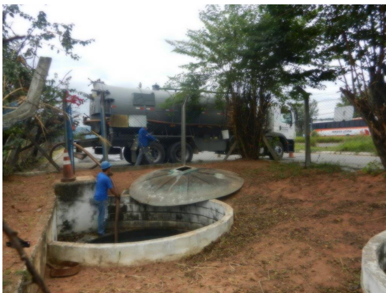
Foto: Lacramento, desativação da saída da ETE Sanitária e Recolhimento do Efluente por empresa licenciada – Brembo do Brasil Ltda