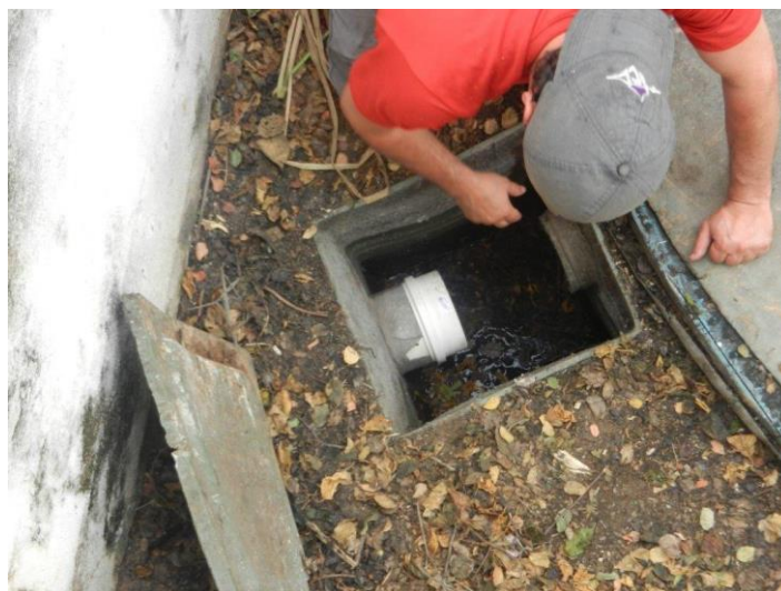
Foto: Lacramento, desativação da saída da ETE Sanitária e Recolhimento do Efluente por empresa licenciada – Brembo do Brasil Ltda