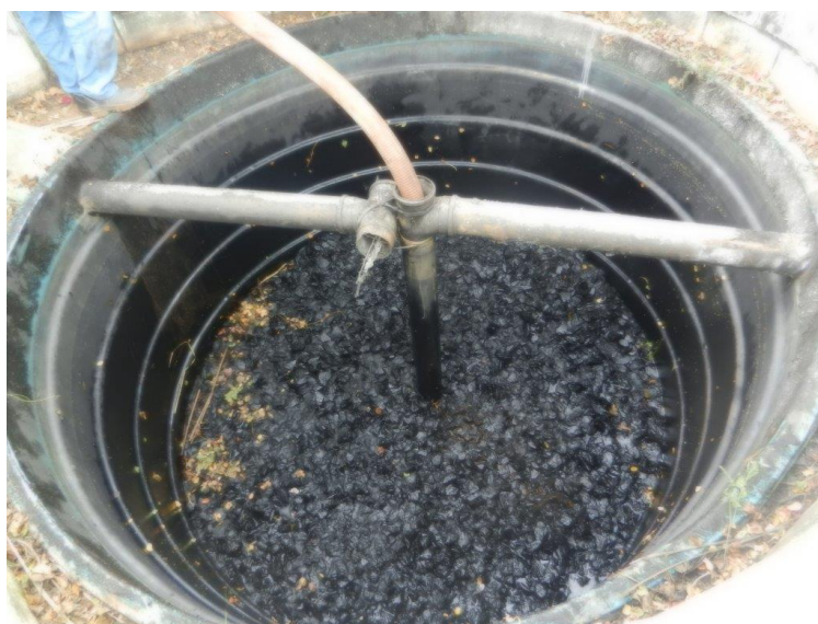
Foto: Lacramento, desativação da saída da ETE Sanitária e Recolhimento do Efluente por empresa licenciada – Brembo do Brasil Ltda