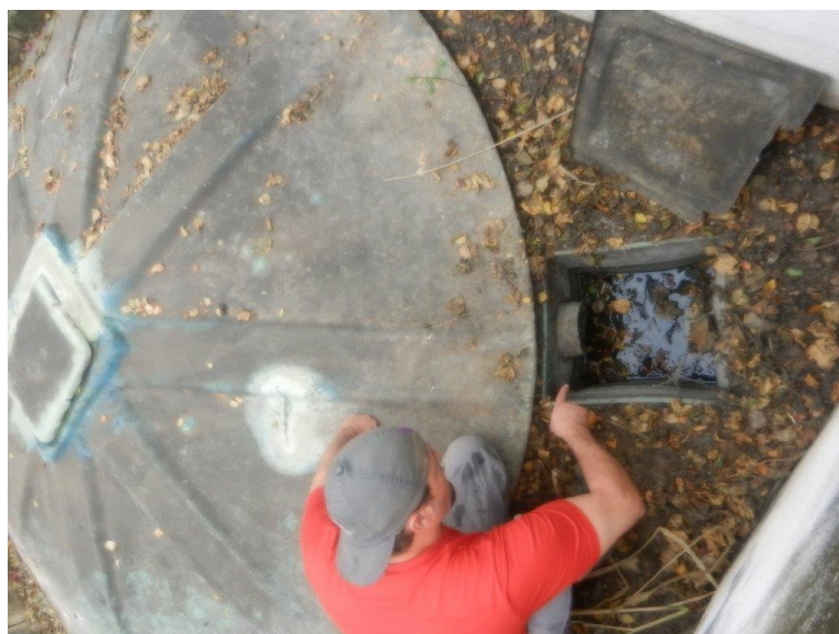
Foto: Lacramento, desativação da saída da ETE Sanitária e Recolhimento do Efluente por empresa licenciada – Brembo do Brasil Ltda