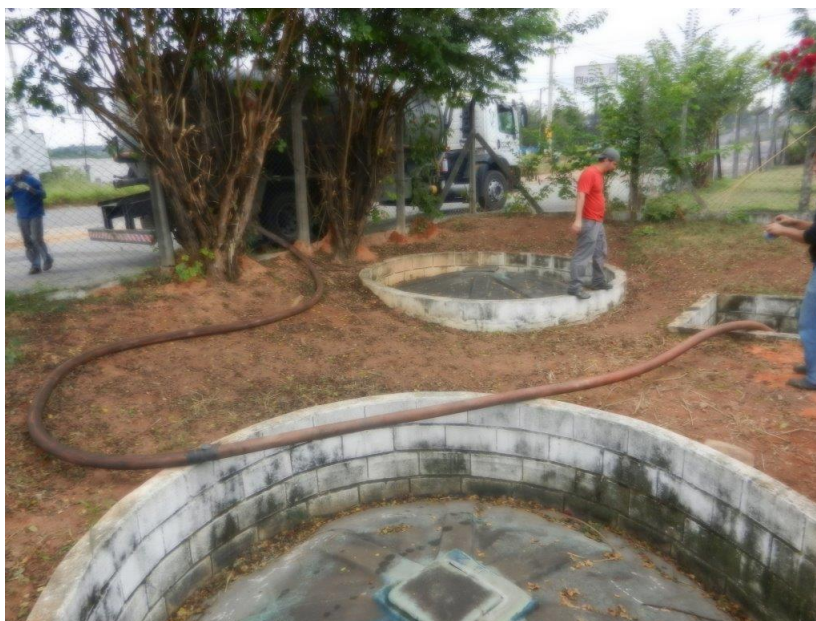
Foto: Lacramento, desativação da saída da ETE Sanitária e Recolhimento do Efluente por empresa licenciada – Brembo do Brasil Ltda