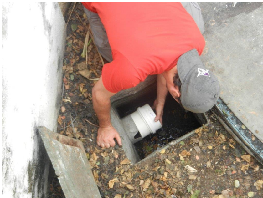
Foto: Lacramento, desativação da saída da ETE Sanitária e Recolhimento do Efluente por empresa licenciada – Brembo do Brasil Ltda