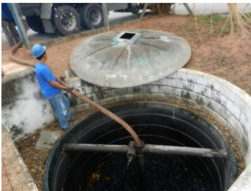
Foto: Lacramento, desativação da saída da ETE Sanitária e Recolhimento do Efluente por empresa licenciada – Brembo do Brasil Ltda