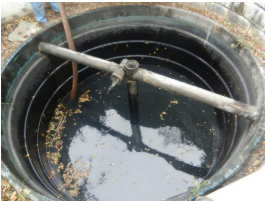
Foto: Lacramento, desativação da saída da ETE Sanitária e Recolhimento do Efluente por empresa licenciada – Brembo do Brasil Ltda