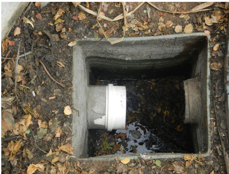
Foto: Lacramento, desativação da saída da ETE Sanitária e Recolhimento do Efluente por empresa licenciada – Brembo do Brasil Ltda