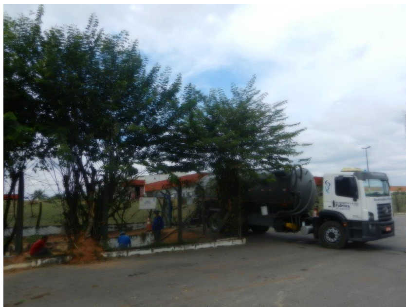
Foto: Lacramento, desativação da saída da ETE Sanitária e Recolhimento do Efluente por empresa licenciada – Brembo do Brasil Ltda