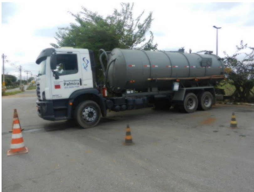
Foto: Lacramento, desativação da saída da ETE Sanitária e Recolhimento do Efluente por empresa licenciada – Brembo do Brasil Ltda