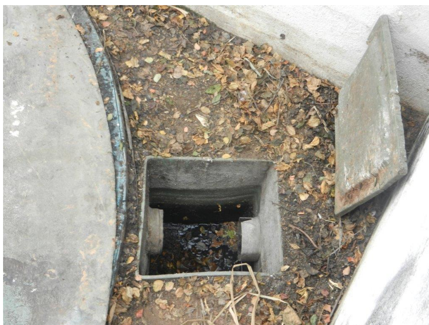
Foto: Lacramento, desativação da saída da ETE Sanitária e Recolhimento do Efluente por empresa licenciada – Brembo do Brasil Ltda