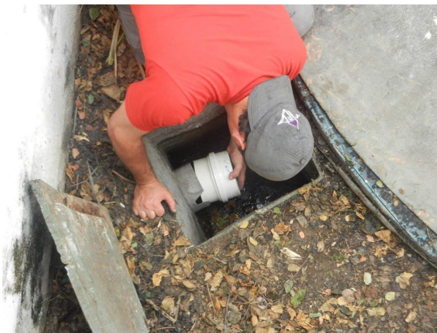
Foto: Lacramento, desativação da saída da ETE Sanitária e Recolhimento do Efluente por empresa licenciada – Brembo do Brasil Ltda