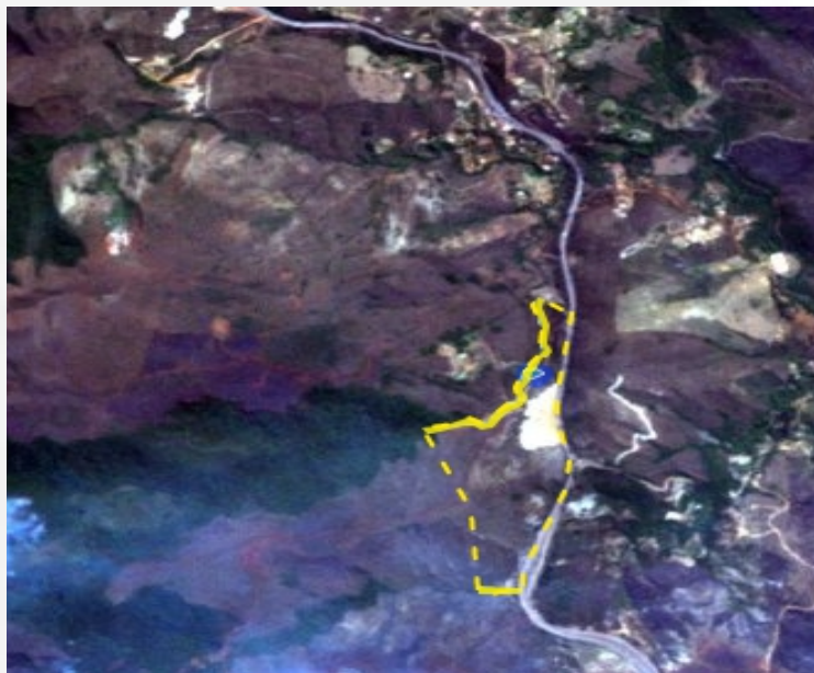
Figura 03– Consulta à plataforma Federal do CAR ( https://www.car.gov.br ) em 01/03/2021

Baseado no CAR apresentado, a área total perfaz 31,95 ha, possuindo 3,42 ha de APP e 1,88 ha de reserva legal, perfazendo 5,89% da propriedade. Foi informado que a área tem reserva legal averbada (AV. 3 na matrícula nº 8.702 de 01/11/2011).