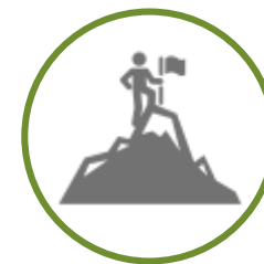
ATIVIDADES DE AVENTURA