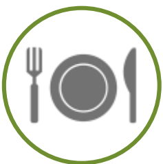
SERVIÇOS DE ALIMENTAÇÃO