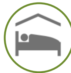
SERVIÇOS DE HOSPEDAGEM