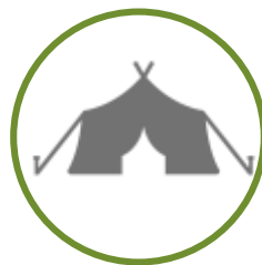
CAMPING / GLAMPING