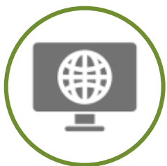
VENDA DE INGRESSO E CONTROLE DE ACESSO / SERVIÇOS ONLINE