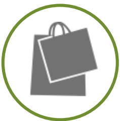
LOJA DE PRODUTOS RELACIONADOS À UNIDADE