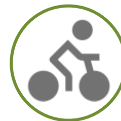
ALUGUEL DE BICICLETA

Premissa: desenho que respeite os atributos ambientais e traga regras de monitoramento de impactos.