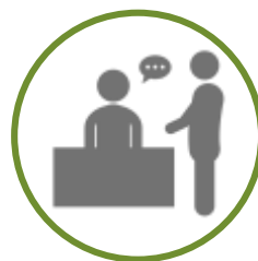
CENTRO DE VISITANTES