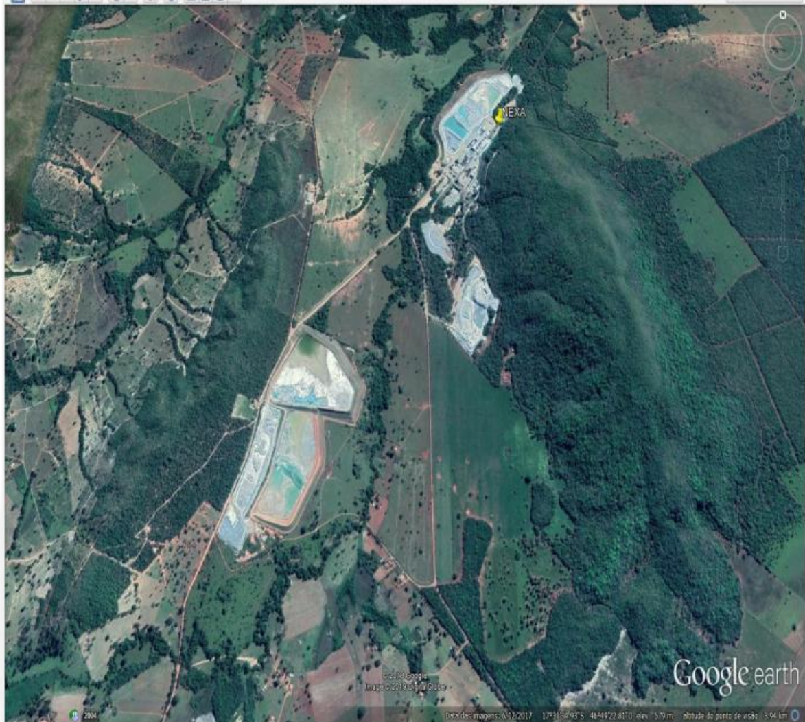
Figura 1: Imagem de satélite da área da Nexa Recursos Minerais S.A. – Morro Agudo.

A capacidade produtiva e efetiva anual prevista, atualmente, é de 1.100.000 ton/ano. Atualmente, a mina subterrânea desenvolve-se a uma profundidade de 650 metros. Conforme o plano de lavra vigente, a data prevista para o fechamento da mina é o ano de 2027 e o descomissionamento da atividade é o ano de 2029.