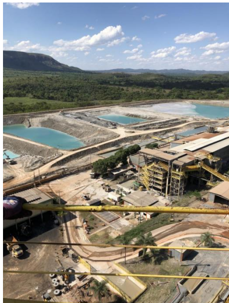
Foto 03. Barragens - B1, B2 e B3