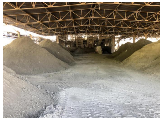
Foto 04. Pátio de estocagem de produto final