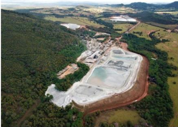
Foto 01. Vista aérea do empreendimento