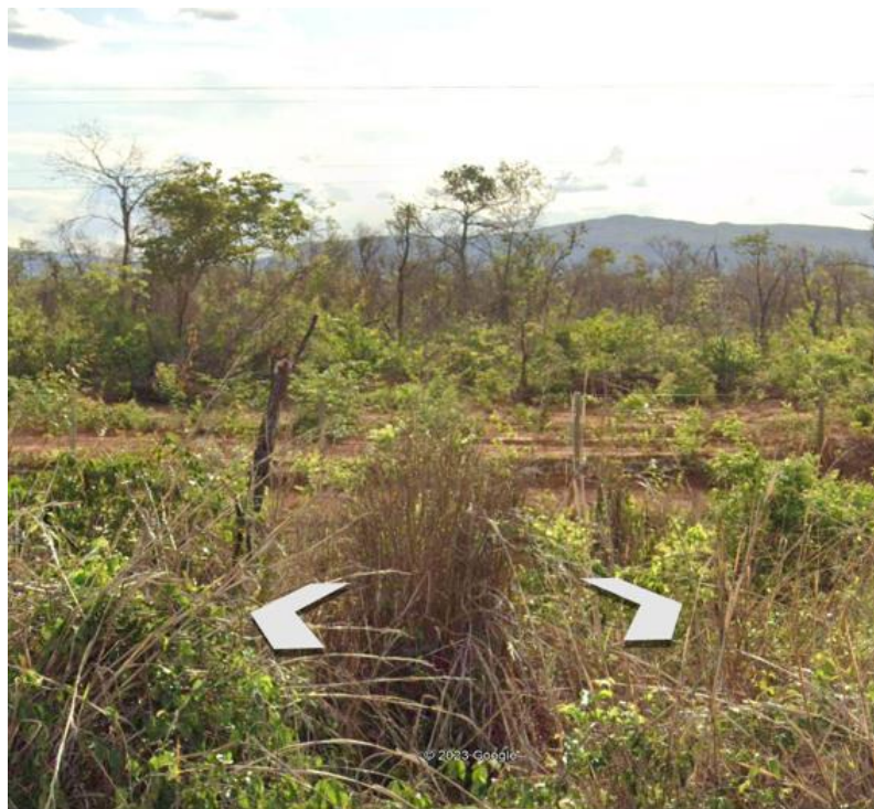
Street View de 11/2022