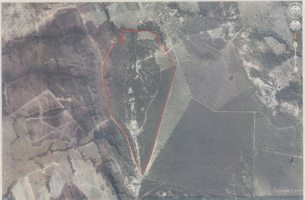
Imagem 02. Área da autuação datada de 2009.