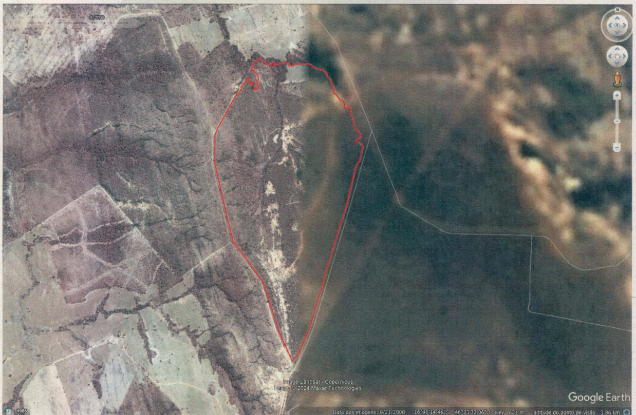
Imagem 01. Área da atuação datada de 2008.

Na presente análise, é possível verificar na comparação das imagens datadas de 2008, 2009, 2020 e 2021, a alteração do uso do solo na maior parte da área, bem como a existência de área com solo exposto sem cobertura vegetal; área de pastagem e área com vegetação não suprimida, conforme apresentado nas imagens 01, 02, 03 e 04 :