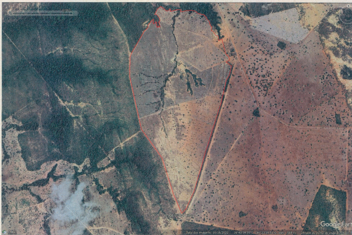
Imagem 04. Área da autuação datada de 2022.

Conforme imagem 5 abaixo, foi delimitada toda a área objeto do Auto de Infração nº 299243/2022, para as adequações das penalidades impostas no referido auto: