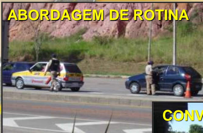
ABORDAGEM DE ROTINA

Agrega o valor da educação ao ato de Fiscalização Rotineiro