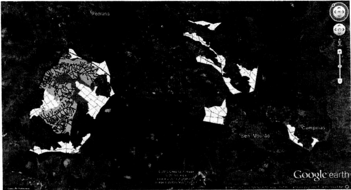
Imagem 2: Imagem aérea do empreendimento. As áreas onde ocorrerão plantios encontram-se demarcadas de amarelo.