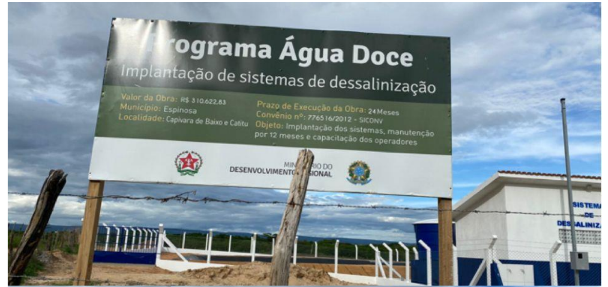
Capivara de Baixo e Caititu