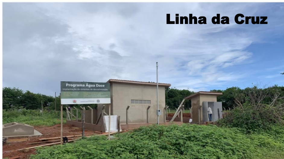
Linha da Cruz